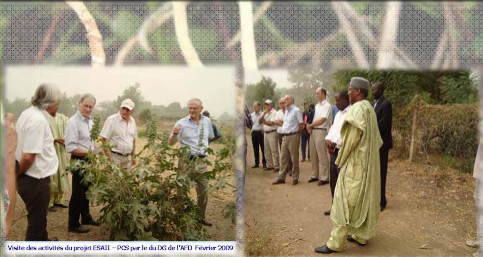
Visite des activités du projet ESAII – PCS par le du DG de l'AFD Février 2009